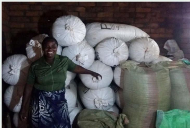
Mfano wa mkulima anayetumia mifuko iliyo boreshwa

ANGALIZO: Hakikisha unahifadhi mfuko huu juu ya mbao kuzuia unyevu.